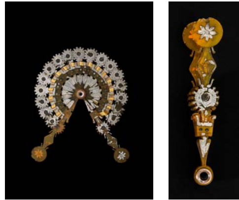
Éventail dit « cocarde » avec optique Vers 1800-1820 Corne, optique à la rivure, L. 20,5 cm/ D.15,5 cm