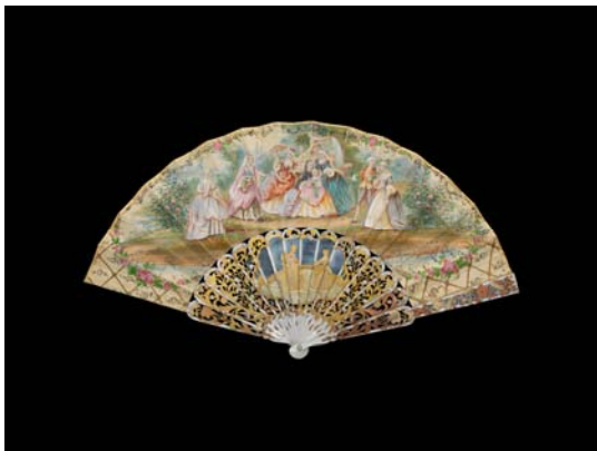
Détente au jardin Vers 1850 Éventail plié, feuille en peau, monture en nacre repercée, gravée et dorée H.t. 25 cm/ H.f. 11,5 cm