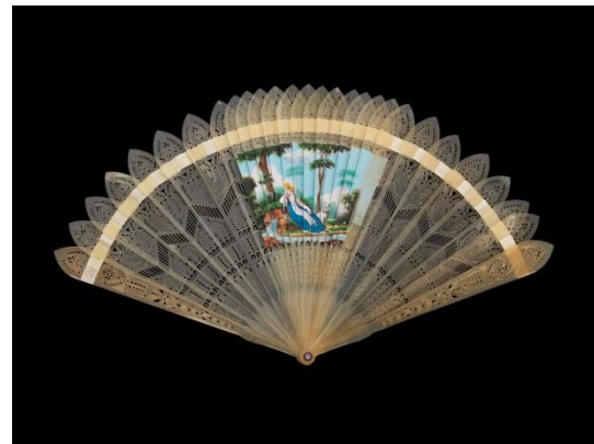
Éventail dit « double-entente » ou « quatre images » Vers 1820 Éventail de type brisé, corne repercée et gouachée, 15,4 cm