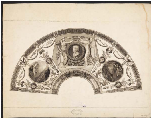
Antoine-Denis Chaudet (1763-1810), Charles Percier (1764-1838), Pierre Fontaine (1762-1853)