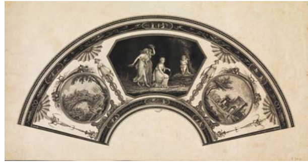
Feuille d'éventail à sujet mythologique et paysage