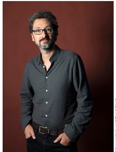
© Francesca Manovani / Editions Gallimard

Son nouveau roman, La Vie heureuse (Gallimard), évoque les «faux» enterrements pratiqués en Corée du Sud afin de redonner aux gens le goût à la vie le temps de quelques heures... Librairie Les Mots et Les Choses. Entrée libre.