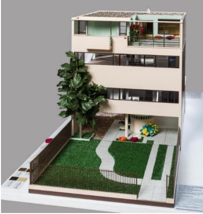
Le Corbusier, Villa Cook, maquette tactile