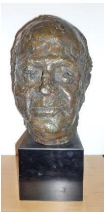
Jacques LIPCHITZ, Arbit Blatas, 1956, bronze