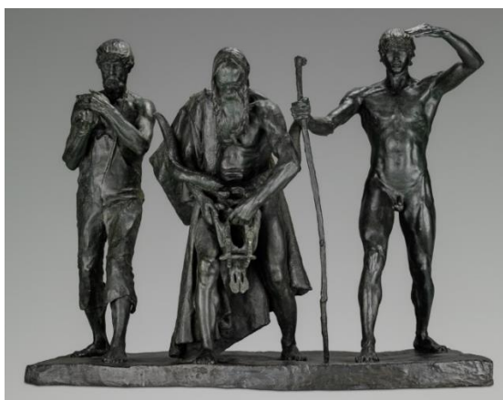
Les fils de Caïn, sans date, bronze