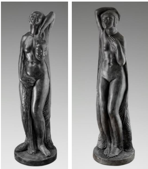
Ernesto CANTO DA MAYA, Tragédie et Comédie, 1926, ciment pierre