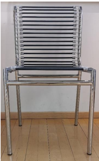
René HERBST, ré-édition de chaise sandoz, métal et plastique