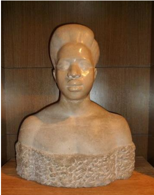
René MERELLE, Le Soudanais, vers 1940, pierre