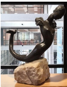
Irène CODREANO, Sirène, 1928, bronze et marbre