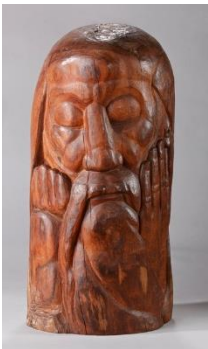
Morice LIPSI, Le prophète, 1924, bois de violette